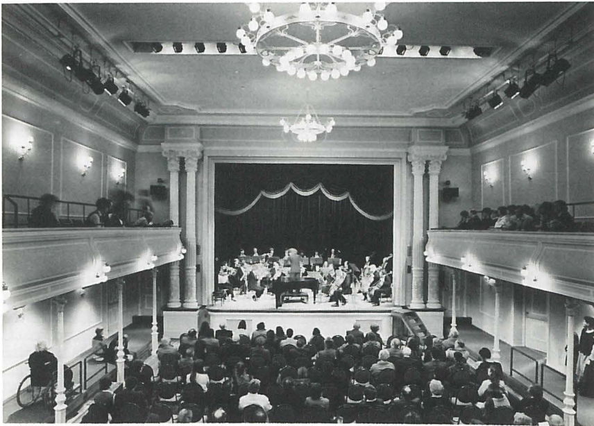
The small theatre restored.