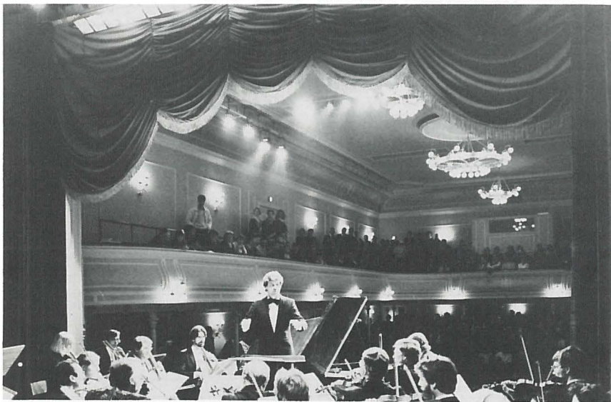
A chamber orchestra in the small theatre.